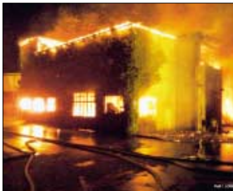
Zu einem Großbrand kam es am 28.5.2002 bei den Firmen Pflanzl und Furadur in Völs