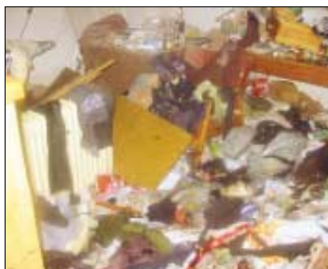
Am 4.5.2002 kam es zu einer Explosion in einer Küche, wo es zu einem Brand kam.