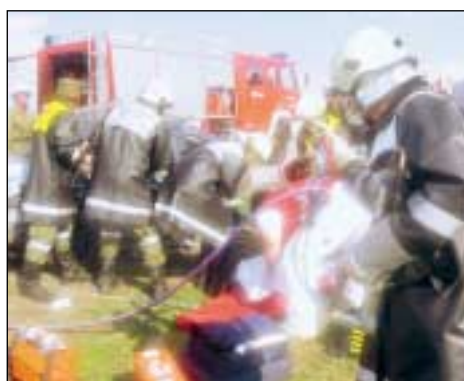
Am 3.4.2002 passierte ein schwerer Verkehrsunfall auf der Axamerstraße, der Fahrer musste mit der Bergeschere befreit werden.