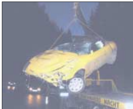
Am 3.2.2002 ereignete sich ein Verkehrsunfall auf der Sellrainerstraße.

Vom 1. Jänner 2002 bis zum 31. Dezember 2002 wurden von der Freiwilligen Feuerwehr Kematen 54 Einsätze bewältigt, davon 9 Brandeinsätze. Die technischen Einsätze stellten mit 26 Ausfahrten auch im vergangenen Jahr den Hauptteil unserer Arbeit dar. Bei 20 Arbeitseinsätzen wurden für die Bürger der Gemeinde Kematen verschiedene Dienste geleistet.