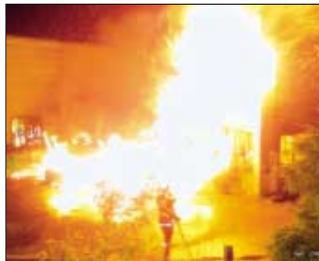
Beim Großbrand in Völs mussten mehrere Feuerwehren helfen, um den Brand zu löschen