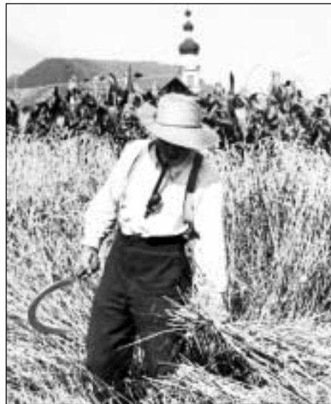
Roggenschnitt in Kematen um 1940