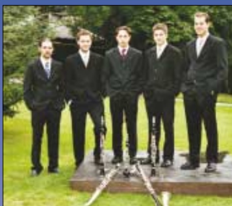
Sonntag, 16. Mai 2004 18:00 Uhr in der Pfarrkirche Kematen working clarinets

29.06.2004 Platzkonzert der Musikkapelle im Musikpavillon