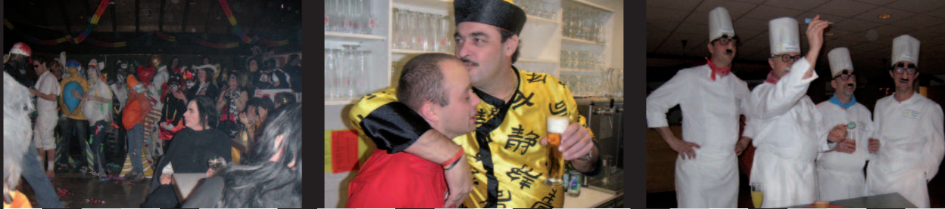
F a s c h i n g s s p l i t t e r 2 0 0 7