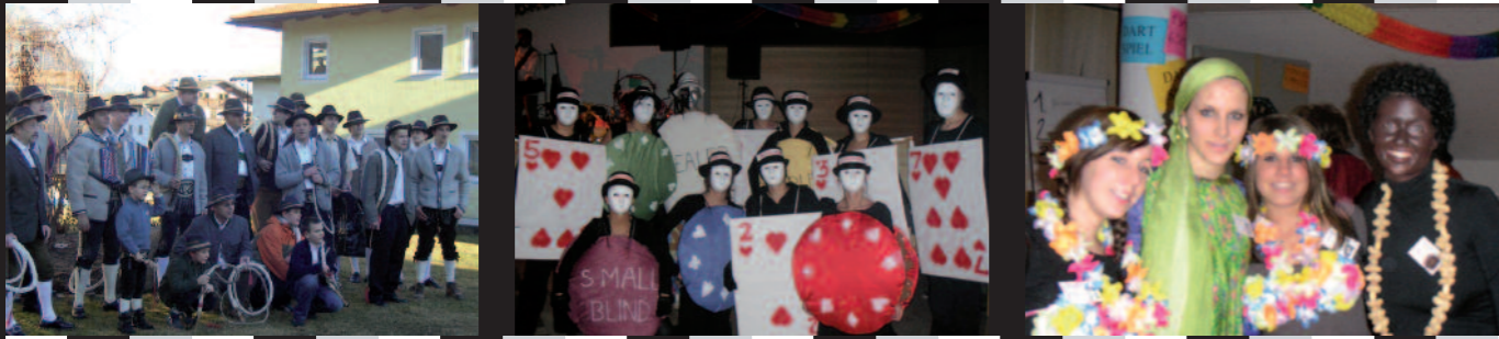
F a s c h i n g s s p l i t t e r 2 0 0 7