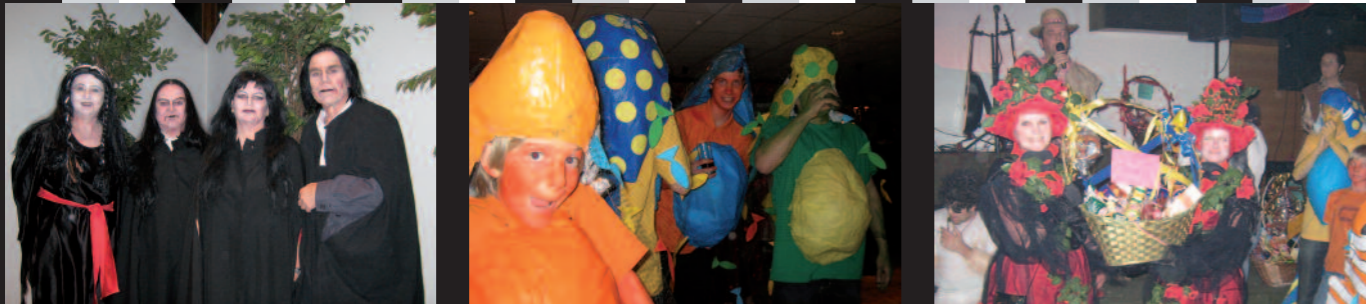
F a s c h i n g s s p l i t t e r 2 0 0 7